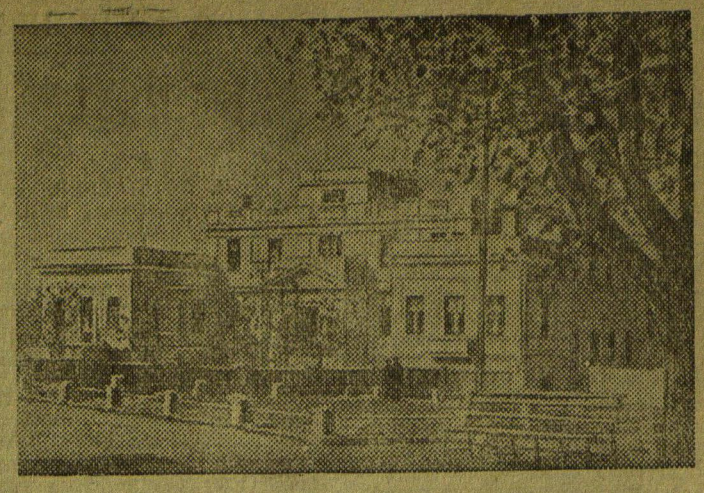
Восстановленное здание биологической станции Академии наук СССР в Севастополе. В мае исполняется 75 лет со дня основания этой станции